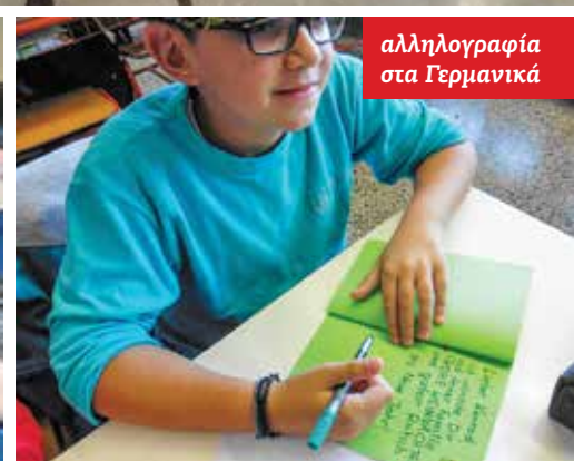
αλληλογραφία στα Γερμανικά