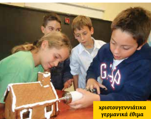
χριστουγεννιάτικα γερμανικά έθιμα