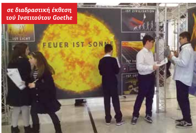
σε διαδραστική έκθεση τού Ινστιτούτου Goethe