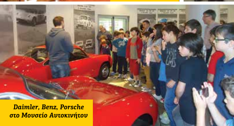
Daimler, Benz, Porsche στο Μουσείο Αυτοκινήτου