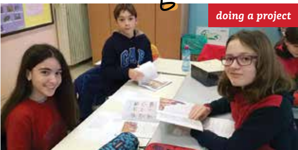
doing a project